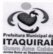
RICARDO FAVARO NETO Prefeito Municipal

Gabinete do Prefeito Municipal de Itaquirai MS, 18 de Fevereiro de 2013.