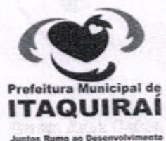
RICARDO FÁVARO NETO Prefeito Municipal

Gabinete do Prefeito Municipal de Itaquirai MS, 20 de Fevereiro de 2013.