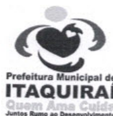
RICARDO FÁVARO NETO Prefeito Municipal

Gabinete do Prefeito Municipal de Itaquirai MS, 20 de Fevereiro de 2014.